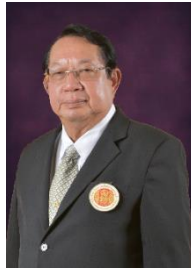
ดร.ชาญเวช บุญประเดิม นายกสภาสถาบันการอาชีวศึกษาภาคกลาง 2